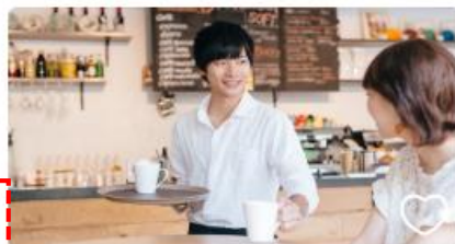
接客マニュアル 0STEP 接客7大用語を身に付ける ★★★★★ 0.0 更新