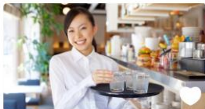
接客マニュアル 3STEP 接客サービスの心構え ★★★★★ 3.0 2018年5月18日更新